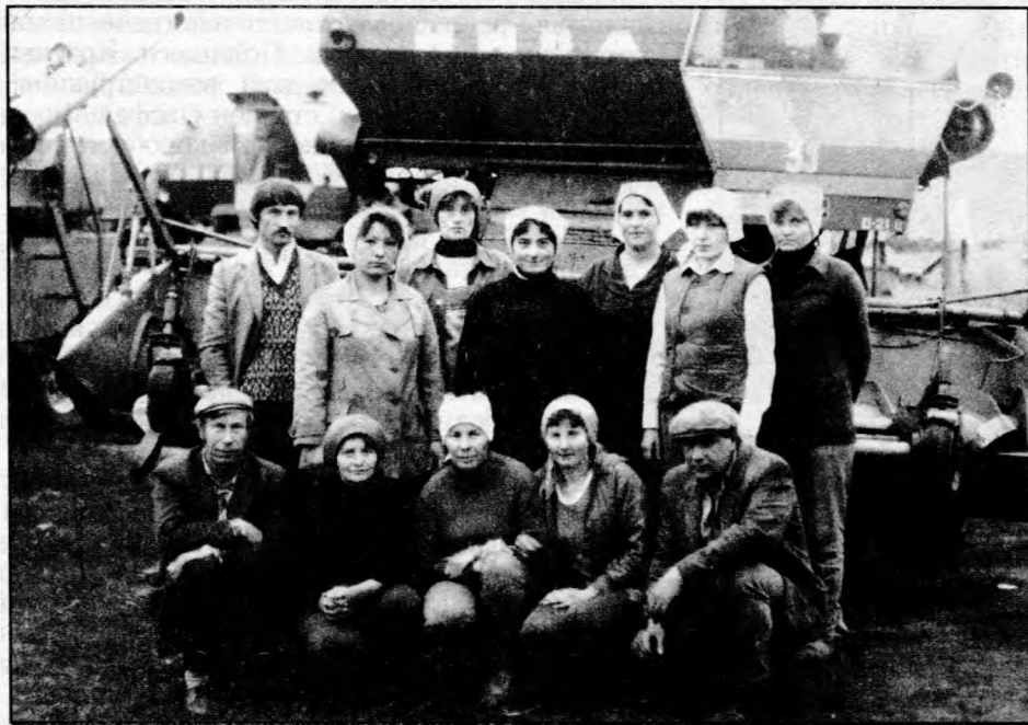
Женское механизированное звено совхоза «Зеленая Поляна». 1986 год

Численность населения по Зеленополянскому сельсовету на 1 января 1988 г. уменьшилась до 982 чел.