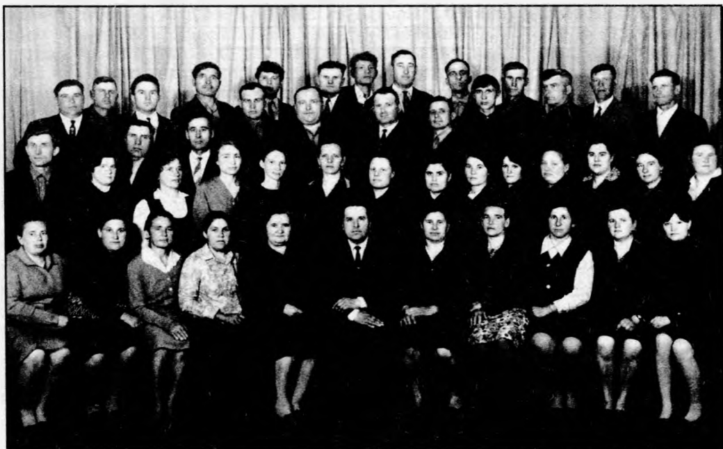
Депутаты Новополтавского сельского Совета 14 созыва. 1973 год

мемориальный парк, который благоустроивали более двухсот рабочих, служащих и специалистов сельского хозяйства, готовили почву к посадке деревьев, укладывали бордюрный камень. Здесь же, на кургане, был возведен мемориал памяти воинам, погибшим в годы Великой Отечественной войны. В 1980 г. в парке возле школы открывалась скульптурная композиция, посвященная подвигу нашей землячки борпроводницы Надежды Курченко (скульптор – Г. Новоселова).