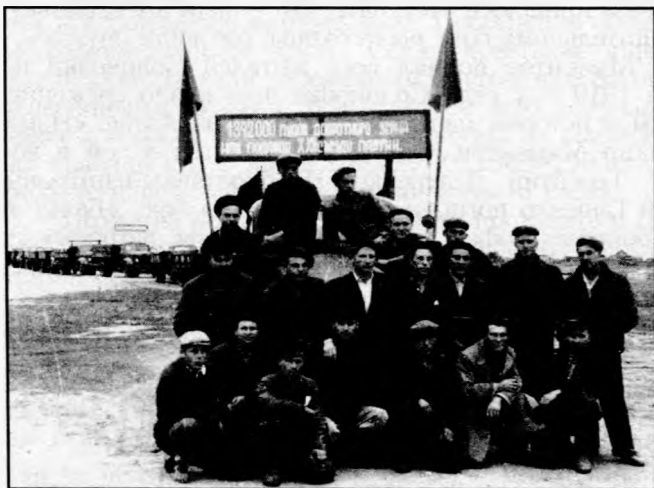
Водители автоколонны совхоза «Ключевский». Отправка зерна в честь XXII съезда КПСС. Село Новополтава. 1961 год