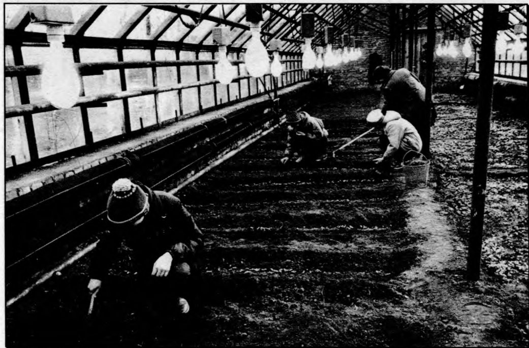
Учащиеся Новополтавской средней школы на работе в теплице. Март 1995 года