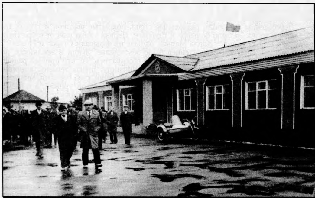
Ввод нового здания Петуховского сельского Совета

Дальнейшая история села связана с производственной деятельностью образованного в 1966 г. совхоза «Петуховский», о котором в этой книге имеется отдельный очерк.