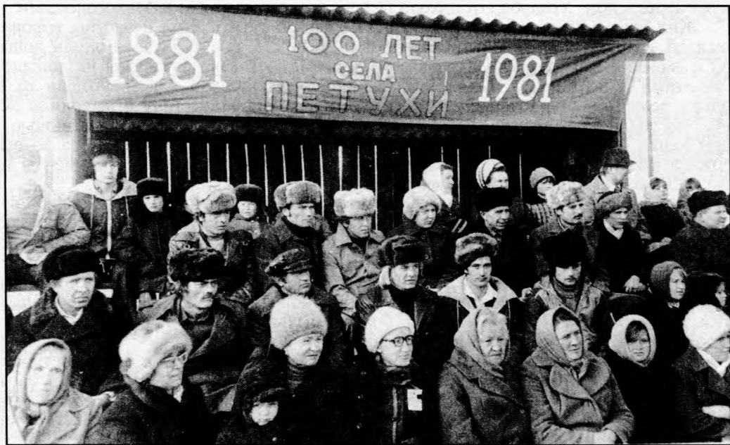
На празднике 100-летия села

В большинстве архивных документов основание с. Петухи относится к 1881 г. Первыми поселенцами были кержаки (староверы) братья Петуховы. По их фами-