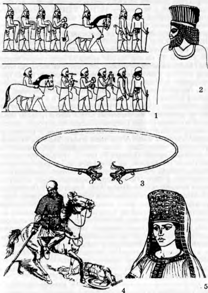
Рис. 4. 1 — Деталь рельефа на лестнице Ападаны в Персеполе. (по Trumpeitmann L., 1988. Abb. 10, 11); 2. — Деталь рельефа на лестнице Ападаны в Персеполе (по Calmeyer P., 1991. Taf. 16, z, прорисовка по фотографии); 3. Реконструкция гривны из могильника Михайловский VI; 4. Скифский всадник V-IV вв. до н.э. Реконструкция по могиле из Солохи (по Сергеев Е.В. 1991); 5. Реконструкция наряда скифской царицы из Толстой могилы. (по Кюско S., 1991, Abb. 6). На рисунке изменена форма гривны.