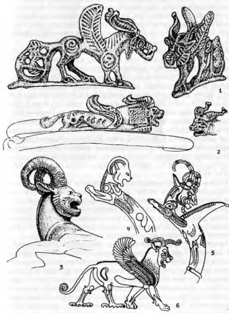
Рис. 2. 1,2 – Сибирская коллекция Петра I (по Руденко С.И., 1962); 3 – J. Paul Getty Museum; 4 - Маниса, муз. г. Измир); 5 - Кукова Могила, муз. г. София; 6 - Сузы (2-6 - по Pfrommer M, 1990a). 1,2,3 – прорисовки по фотографиям.